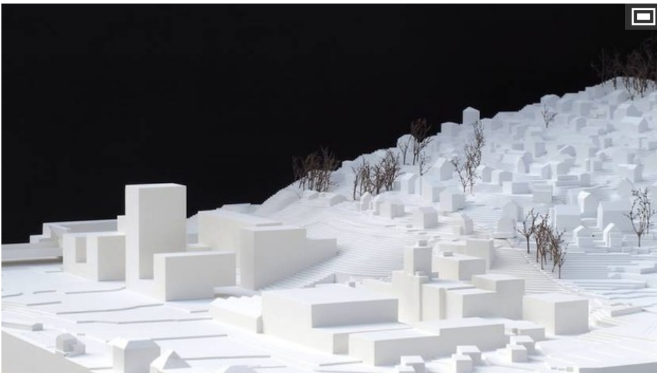
Modell der redimensionierten Überbauung auf dem Areal Eichhof West.

Statt zwei Hochhäusern nur noch eines - und auch ein 15 Meter weniger hohes: Auf dem Areal Eichhof West in Kriens soll ein 53 Meter-Haus gebaut werden. Der Krienser Gemeinderat würdigt den neuen Bebauungsplan positiv.